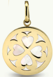
Anhänger 585 GG | Perlmutter Kleeblatt 369 00 Kreuz 299 00